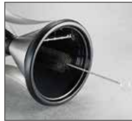
クリーニングブラシ付き 奥まで届いて掃除ができます。