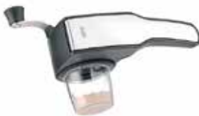
Rotary grater PECORINO LASER CUT