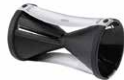
Spiral slicer SPIRELLI