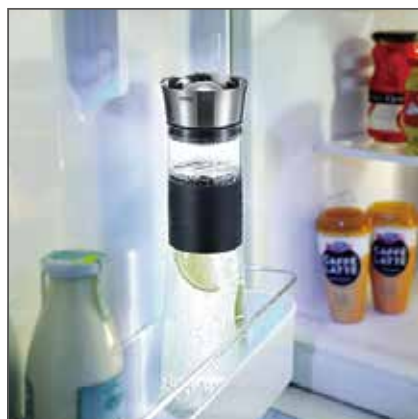
■冷蔵庫のドアポケットに入ります。