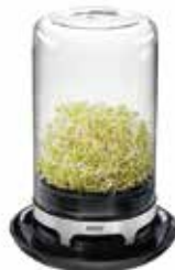
Pasta and salad tongs INSPIRIA