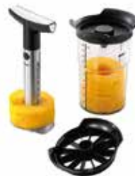
Gourmet cutter VIOLINO

award-winning product functionality innovation special mention