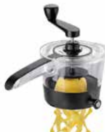
Spiral slicer SPIRALFIX

award-winning product product benefit / design / functionality Consumer Choice