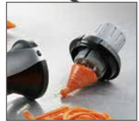
ベジタブルホルダー付き 3本のステンレススチールピンで野菜を固定するため、最後まで野菜を使い切れます。