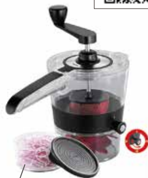
フードコンテナ付き

スライスした食材は、付属のフタ付きコンテナで保存できます。(コンテナサイズ：φ10×8cm)