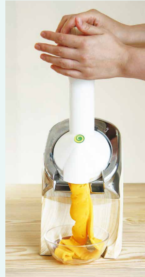
②スカッシュスティックで奥まで押すと、なめらかなヨナナスが出てくる。(スカッシュ)