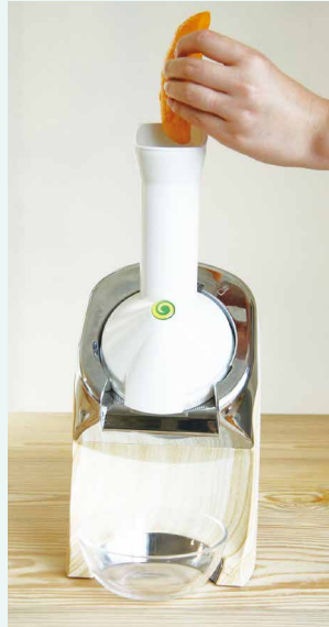
①ヨナナスメーカーに冷凍マンゴーを入れる。(ドロップ)