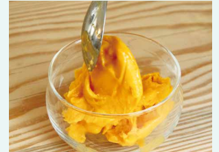
④全体をよく混ぜ合わせて器に盛り、できあがり!