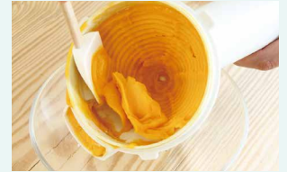
③ヨナナスメーカーの中にもヨナナスが溜まっているので、ゴムベラなどで取り出す。