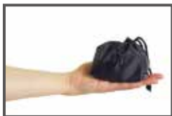
手のひらサイズに収納