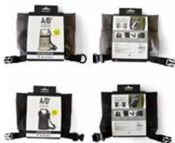
A/D2 レインショルダーバッグ