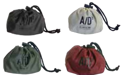
A/D2 アンブレラカバー