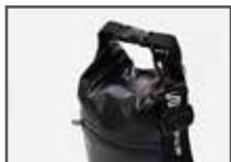
ロールトップ構造